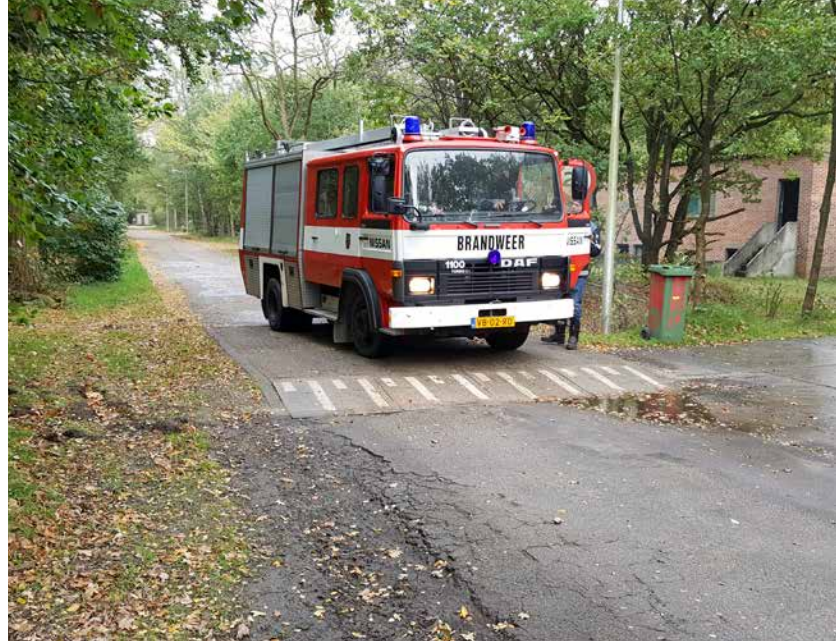
Brandweertaken naar de GBA, specialistische taken naar first responders bno.

Voor een havengebied dient specifieke hulpverleningscapaciteit te worden georganiseerd: een brand- en hulpverleningsorganisatie die kan optreden bij branden, spills, ongevallen, hulpverleningen en uitval van nutsvoorzieningen in het gebied. In Amsterdam organiseren partijen die hulpverleningsorganisatie samen: de Gezamenlijke Brandweer Amsterdam. De GBA is een samenwerkingsinitiatief van drie (groepen) stakeholders: het gezamenlijke bedrijfsleven in de haven van